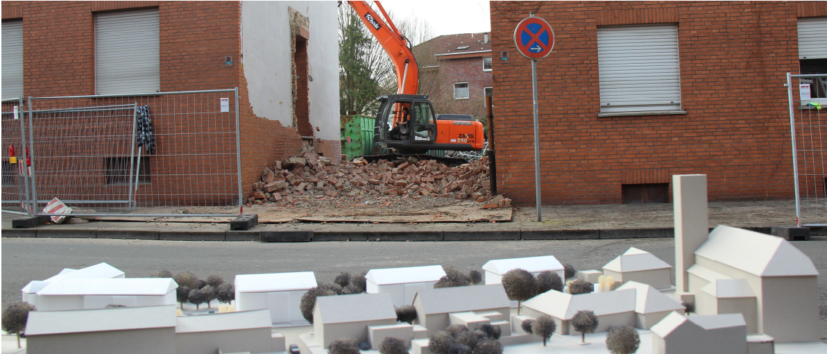
Bauvorhaben Darbrookstraße