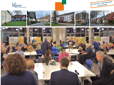
Ausschnitt Einladung, Forum

Kommen Sie, informieren Sie sich und reden Sie mit!