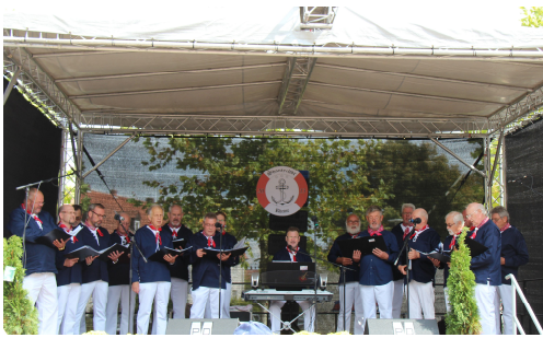
Auftritt Shantychor Rheine

Ein Fest-Nachtreffen hat ergeben, dass das Fest alle zwei Jahre stattfinden soll (gerade Jahreszahlen) und das auch wenn es keine Förderung mehr über die Soziale Stadt gibt. Es gab bereits erste Finanzierungsideen.